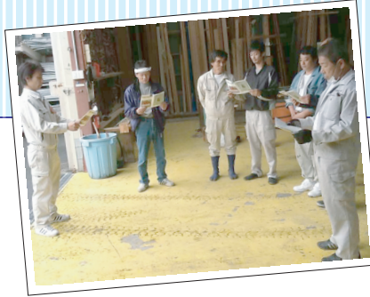
<朝礼風景> 朝、仕事を始める前に みんなで気持ちを一つに