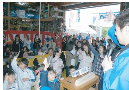
2008年から毎年開催している大感謝祭

お客さんが笑って遊んで楽し んで頂けるように、そして私 自身も楽しくお仕事が出来る ようにおもしろ勉強イベント を色々行っています。 是非一度バスツアーにも参加 して下さい。