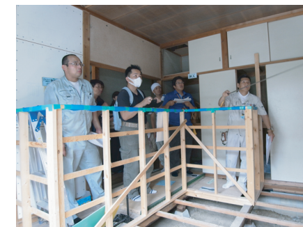
▲寿町、耐震モデル住宅にて

また、自治体からの講師の要請を受け、各公民館などで一般の方にも分かりやすい耐震診断・改修工事の方法をお教えています。