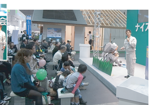
◀おおさか防災スクラム (高槻ア外アモール・2009年)