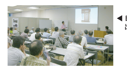
◀自治体対象 出前講座(寝屋川八幡台)