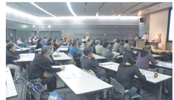
▲一般向け「住まいの耐震セミナー」の様子