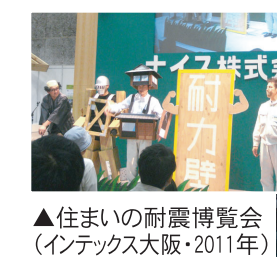
▲住まいの耐震博覧会 (インテックス大阪・2011年)